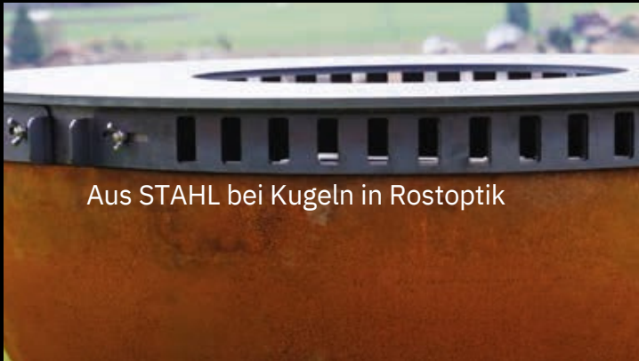
Aus STAHL bei Kugeln in Rostoptik