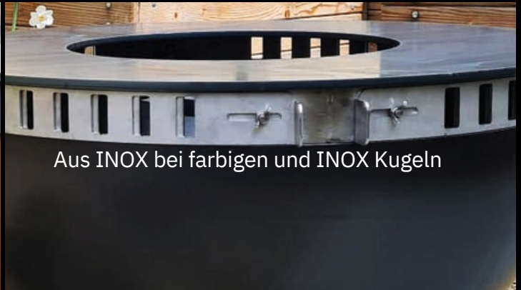
Aus INOX bei farbigen und INOX Kugeln